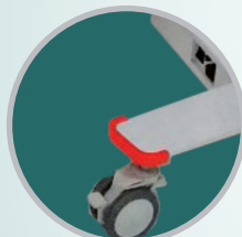
4 RODA (2 roda dengan rem)