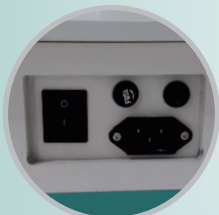
TOMBOL ON/OFF & SOKET AC POWER