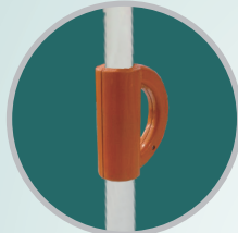
PEGANGAN (Terbuat dari plastik)