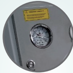
Pressure Gauge dan Pressure Regulator